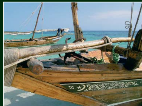
Proue de dhow - Zanzibar.

Nous vous convions cette année encore à partager avec nous cette aventure africaine sur le mode d'un voyage quasi initiatique.