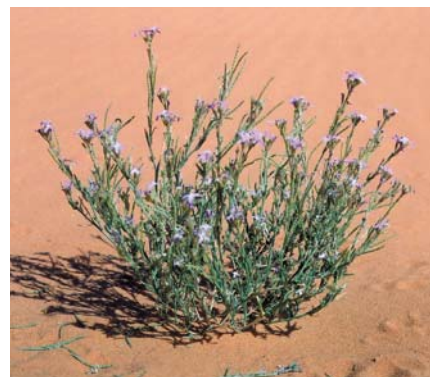
Almarujat, Eremobium Aegyptiacum.