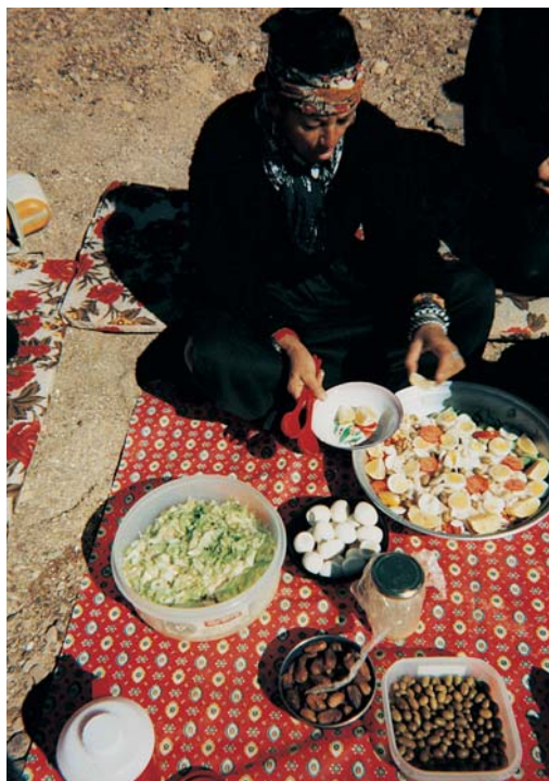
Des produits frais.

L'hébergement est prévu en chambre double. On peut disposer d'une chambre individuelle (single) moyennant un supplément.