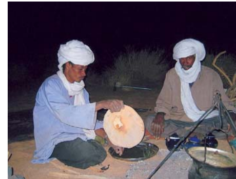
L'art de la galette.