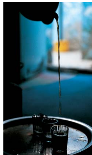
L'art du thé...

Les repas, adaptés aux conditions de voyage, empruntent à la cuisine locale autant qu'à la cuisine française . A midi, le cuisinier prépare des salades variées avec les produits frais locaux et, le soir, des repas chauds.