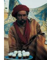
Note d'humour !